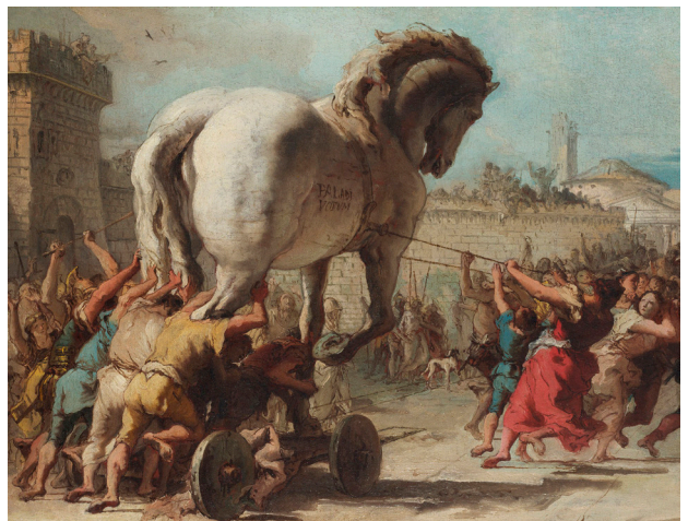
Giovanni Domenico Tiepolo – La Procession du Cheval de Troie à Troie (vers 1760)

Le cheval de Troie: une histoire de ruse et de massacre