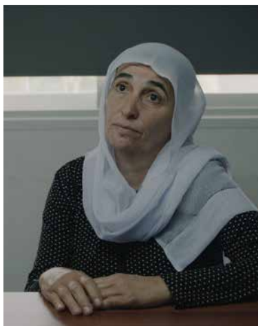
Foragers de Jumana Manna © Jumana Manna