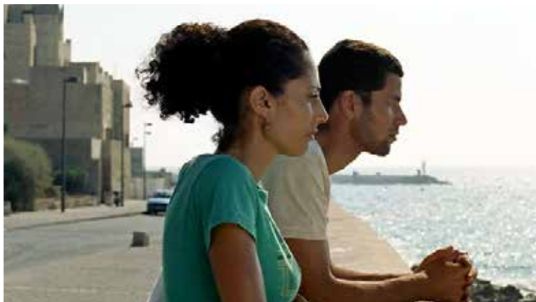
Le Sél de la mer de Annemarie Jacir