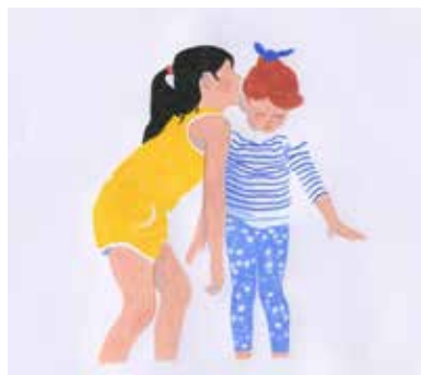
Été 96 de Mathilde Bédouet © L'Heure d'été

Retrouvez la programmation de court métrages à destination du tout jeune public page 17