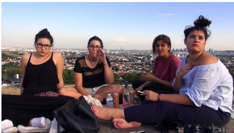
J' suis pas malheureuse